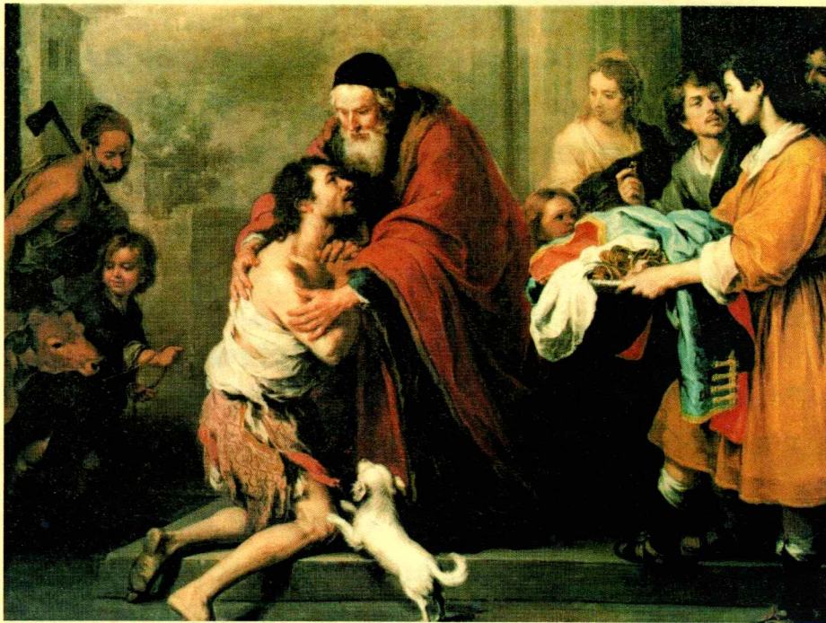
Le retour du fils prodigue Bartolomé Murillo, 1670

« Maintenant, revenez à moi de tout votre cœur »